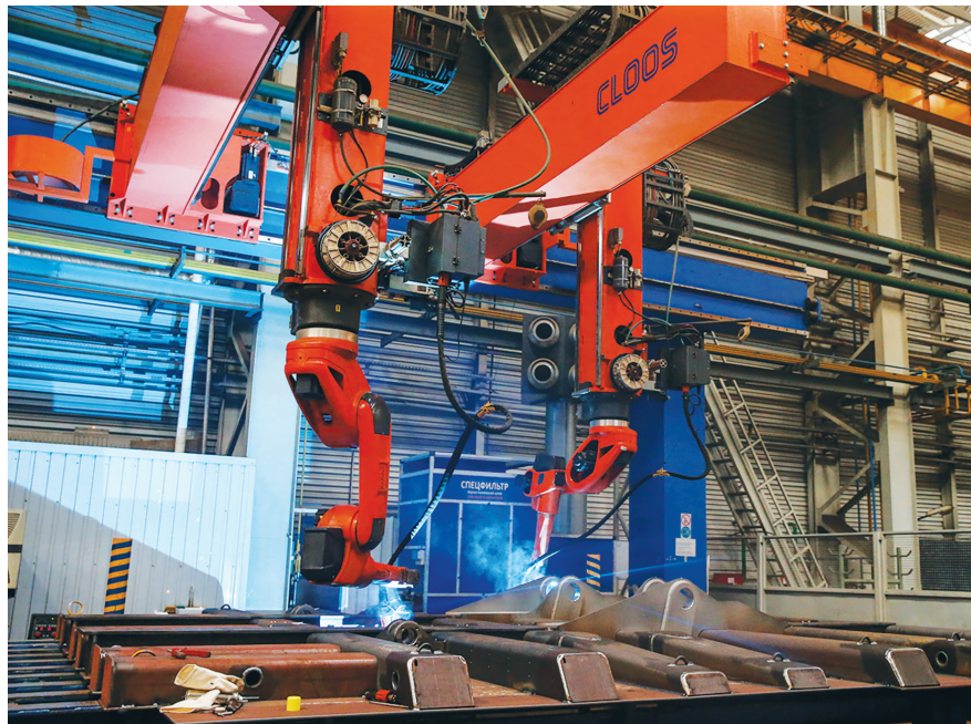
В цеху ОАО «БЕЛАЗ»

За прошлое пятилетие сэкономлено более 5 млн т у.т., на текущее поставлена задача – порядка 3 млн т у.т. И более 50 % всей экономии достигается благодаря новому оборудованию, технологиям, материалам. Все это говорит о том, что наши субъекты хозяйствования понимают необходимость внедрения эффективного оборудования для повышения своей конкурентоспособности. Сейчас нет жесткого административного регулирования этого процесса, мы оказываем больше консультативную помощь предприятиям и организа-