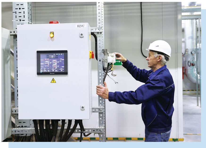
Самая мощная котельная в Беларуси, которая в качестве основного топлива использует фрезерный торф (г. Столбцы)

сетей, использования технологий аккумулирования тепловой и электрической энергии.